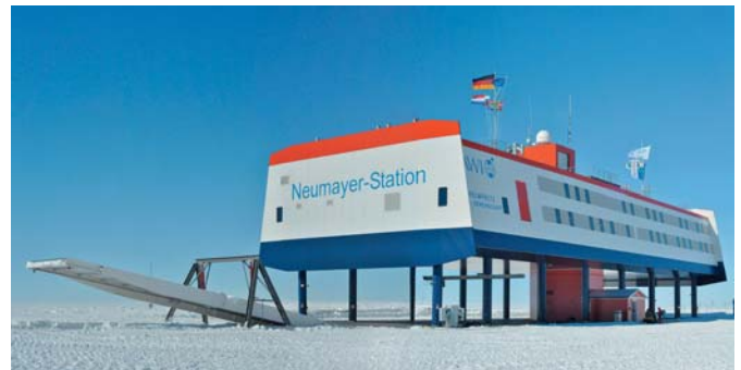
Abb. 1: Neumayer-Station III am Tag der Einweihung, 20. Februar 2009. Das etwa 2.600 t schwere Bauwerk ist im Eis gegründet. Die Plattform ist 68 m lang und 24 m breit. Sie befindet sich 6 m über der Schneeoberfläche. Hier sind die wissenschaftlichen und technischen Einrichtungen untergebracht. Die Gesamthöhe einschließlich Ballonhalle auf dem Dach beträgt 21 m. Die Garagenektion unter der Schneeoberfläche ist 76 m lang, 26 m breit und 8 m tief. Über eine Rampe an der Nordseite können die Fahrzeuge in die Garage gefahren werden.

Bei der Konzeption der Neumayer-Station III wurden neue Wege beschritten, damit sowohl die baulichen Anforderungen an eine nachhaltige Lebenszeit des Gebäudes sowie auch an die moderne Ausstattung für Forschung und Logistik, an verbesserte Lebens- und Arbeitsbedingungen für die Überwinterung und an die Unterbringung von zusätzlichem Personal in