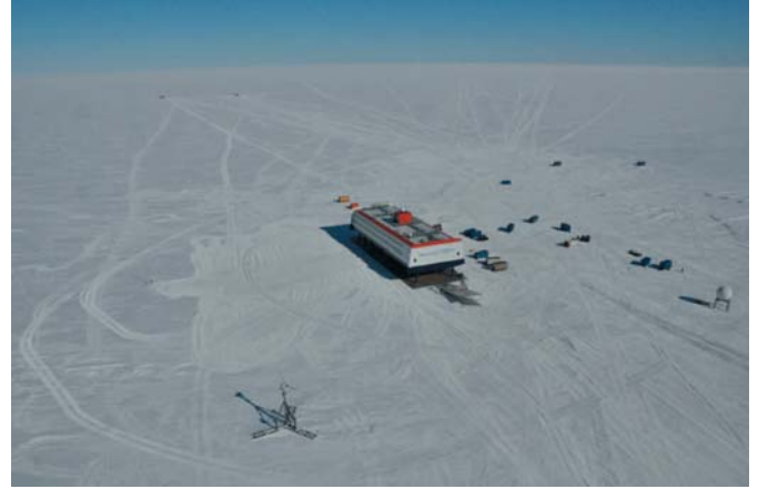
Abb. 6: Umgebung der Neumayer-Station III aus Nordost gesehen, getrennt vom Stationsgebäude sind das Windkraftwerk und die Antenne für die Satelliten-Standleitung aufgebaut. Etwa 1,5 km südlich befinden sich das Spurenstoff-Observatorium und das Magnetik-Observatorium. Südwestlich in etwa 3,5 km Entfernung ist das Infraschall-Array verlegt.

An der Neumayer-Station III werden Polarfahrzeuge, Schlitten und mobile Unterkünfte für wissenschaftliche Traversen und Versorgungsfahrten vorgehalten. Auch die Sommerbasis Kohnen-Station (75°00' S, 00°04' W) auf dem Inlandeis, 757 km südlich der Atka-Bucht, wird so versorgt. Die Neumayer-Station III ist auch für den Polarflugbetrieb eingerichtet. Kleine Flugzeuge mit Skifahrwerk wie die POLAR 5 können von hier aus logistische und wissenschaftliche Flugmissionen durchführen. Für die Transporte von Personal und spezieller Fracht zur Neumayer-Station III ist die internationale Luftbrücke Dronning Maud Land Air Network (DROMLAN) das logistische Rückgrat. Im Rahmen dieser Zusammenarbeit werden je nach Bedarf in der Sommerperiode von November bis Februar interkontinentale Flüge mit einem Frachtflugzeug IL-76TD von Kapstadt in die Antarktis und zurück durchgeführt.