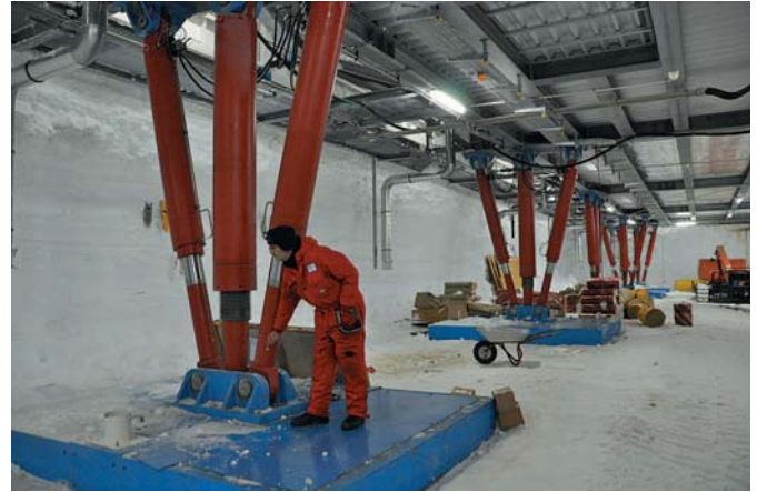
Abb. 3: In der Garage befinden sich die 16 Stützen, die als Bipoden mit je zwei Hydraulikzylindern ausgebildet sind. Das flexible Tragsystem gleicht Fundamentsetzungen aus, leitet horizontale Lasten in den Schneegrund ab und einmal im Jahr wird damit das Bauwerk als Ganzes angehoben. Anschließend werden die Fundamentplatten nacheinander angehoben und mit Schnee unterfüllt.

Die wissenschaftlichen und technischen Einrichtungen sind in vier Ebenen untergebracht. In der Garage (Deck U2) stehen die Fahrzeuge und anderes Großgerät. In die Stahlkonstruktion