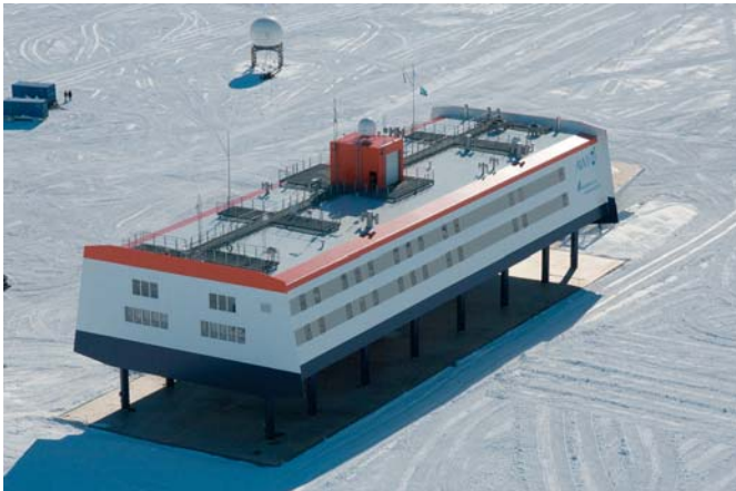
Abb. 5: Auf dem Dach des Gebäudes (Deck 3) befindet sich die Ballonfüllhalle. Wissenschaftliche Instrumente und Antennen sind auf den Gitterrosten und an den Geländern montiert. Im Hintergrund steht das Radom mit der Satellitenantenne für die Standleitung.