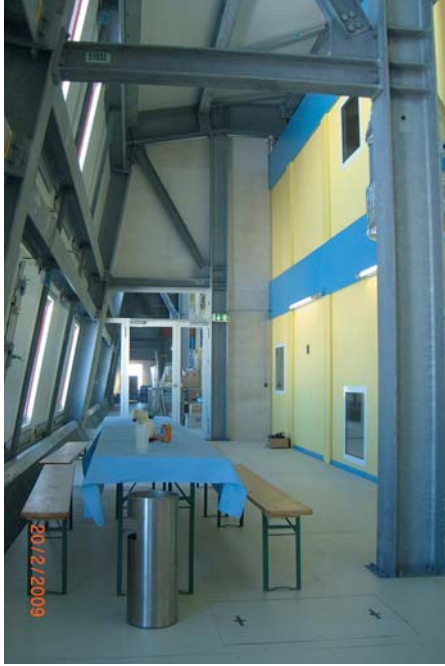
Abb. 4: Auf Höhe Deck 1 zwischen der Außenhülle (links) und den in zwei Ebenen montierten Modulen (rechts) steht weitere geschützte Nutzfläche zur Verfügung (Foto: H. Gernandt, AWI).